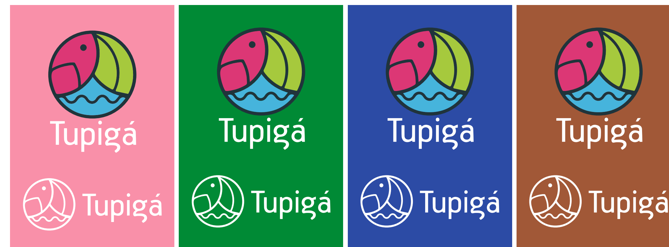
Aplicações permitidas nos tons secundários.