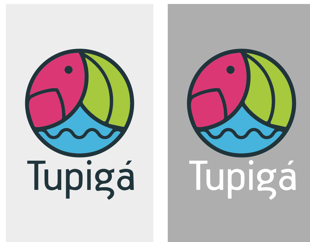
Versões coloridas para aplicações em fundo de tons neutros.