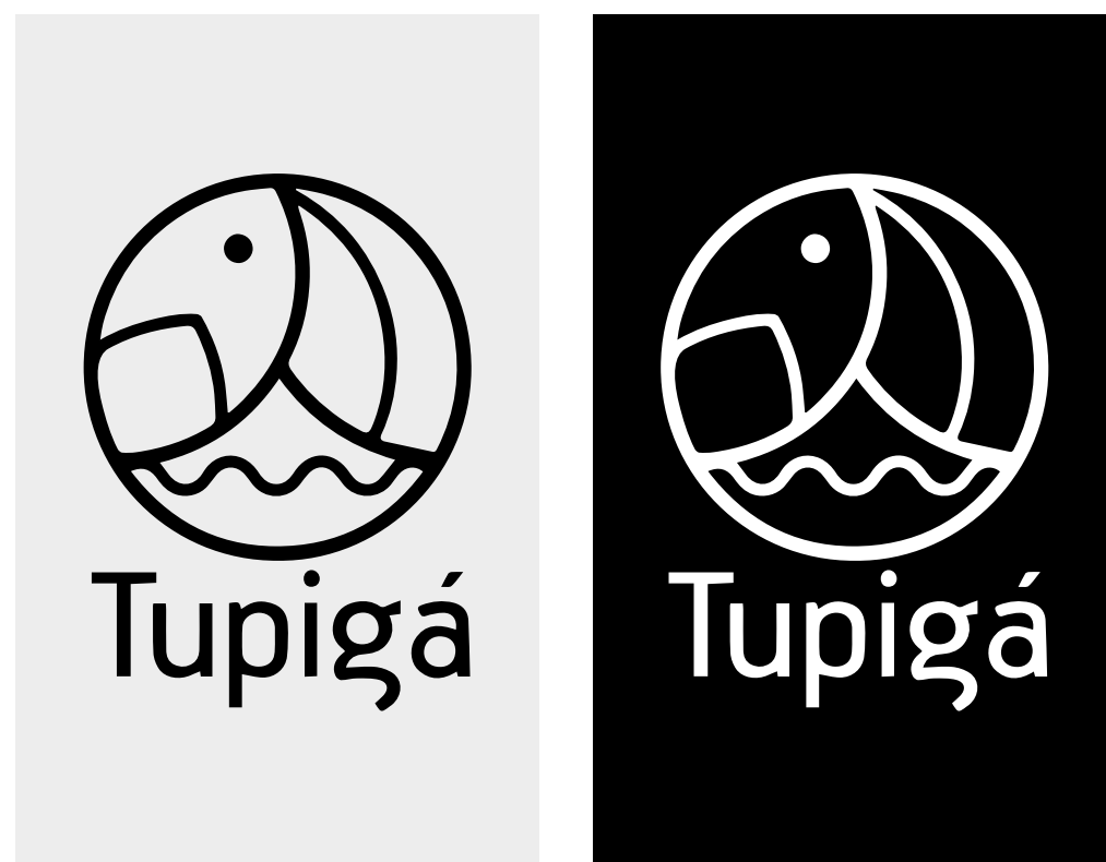
Versões preta e branca para aplicações com fundo de alto contraste.